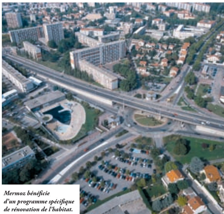
Mermoz bénéficie d'un programme spécifique de rénovation de l'habitat.

Parallèlement, le quartier bénéficie d'un programme spécifique