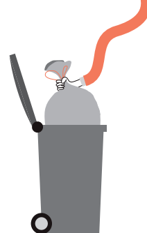
COLLECTE DES ORDURES MÉNAGÈRES [BAC GRIS]