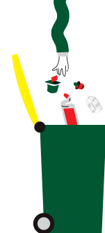
COLLECTE SÉLECTIVE [BAC DE TRI]

EN VRAC DANS LE BAC DE TRI, LES EMBALLAGES ET PAPIERS