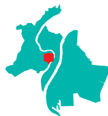
Plan d'accès au dos

Vous habitez le centre de Lyon, ou bien vous n'avez pas la possibilité de vous rendre dans les déchèteries du Grand Lyon ? Bonne nouvelle ! Désormais, la déchèterie fluviale River'Tri vient à vous : une barge spécialement équipée pour récupérer ce que vous souhaitez jeter.