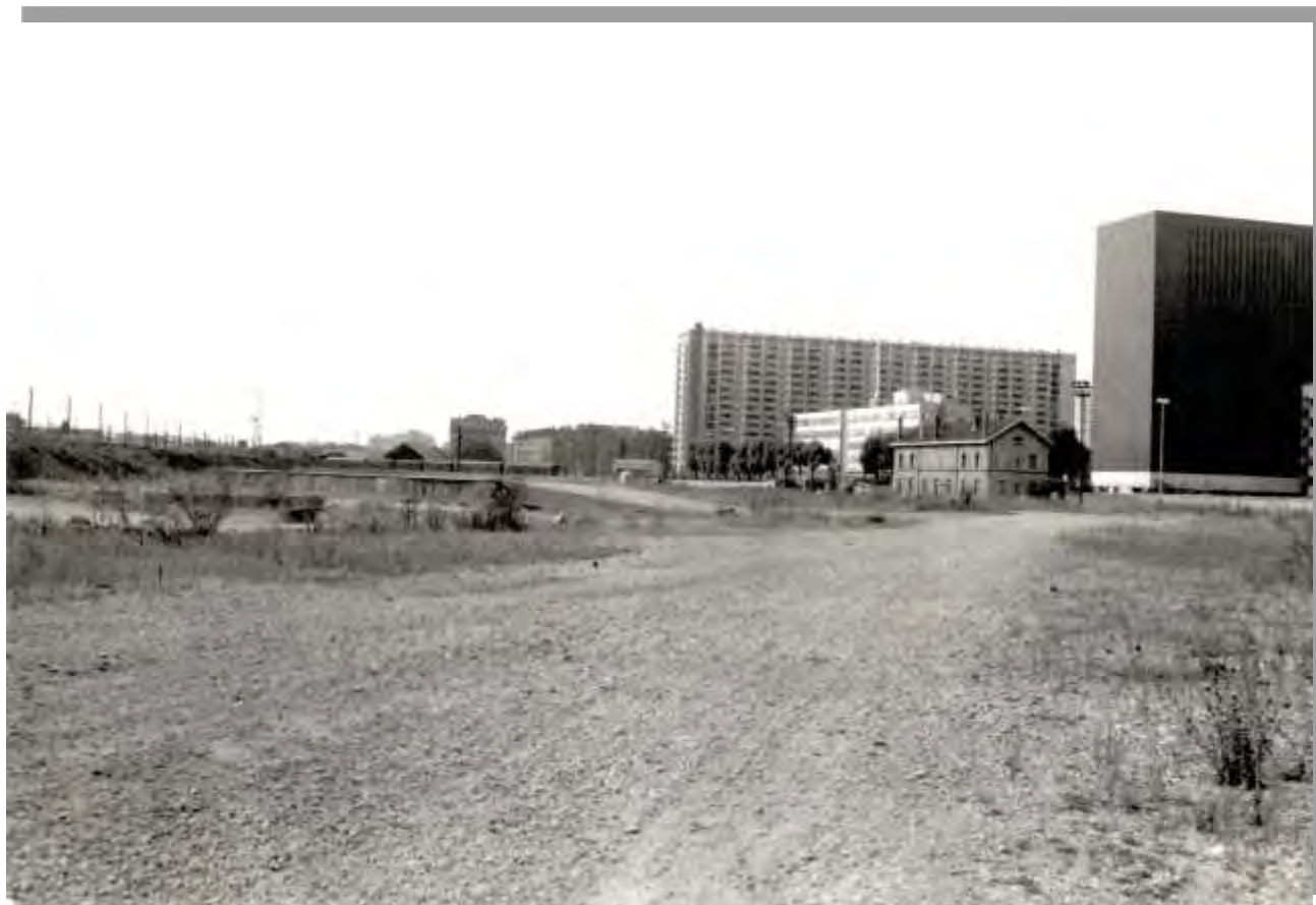
Figure 4 – Photographie de la résidence Desaix, du siège de la Radio-Télévision Française et du silo de la Bibliothèque de la Part-Dieu [1972-1978].

halles de Lyon, qui déménagent, ainsi que les bâtiments de la Radio-Télévision Française (aujourd'hui France 3). La SERL est elle-même basée dans le quartier.