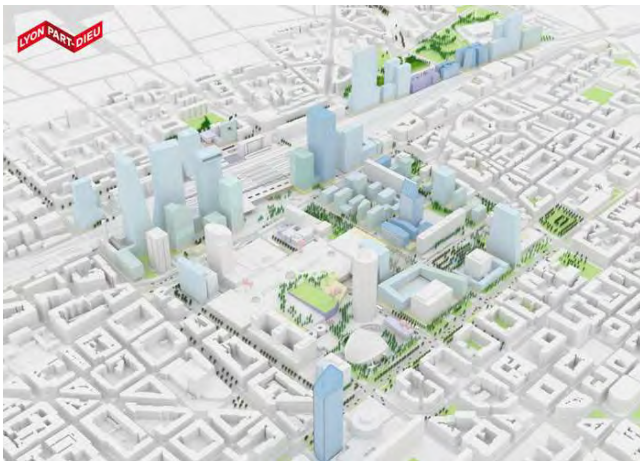
Figure 9 - Plan de référence urbain (l'AUC) – intentions à terme.

La poursuite du projet Lyon Part-Dieu est prévue au moins jusqu'en 2020, mais il existe déjà des projets jusqu'en 2030, voir 2050. L'ensemble du projet voulu par l'AUC va faire évoluer la skyline lyonnaise avec la construction de plusieurs tours de grande hauteur.