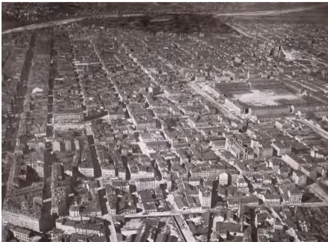
Figure 2 - Vue aérienne de la partie sud de la Part-Dieu vers 1930.

la cession de la caserne militaire. L'acquisition aboutit avec le maire Louis Pradel qui succède à Édouard Herriot en 1957.