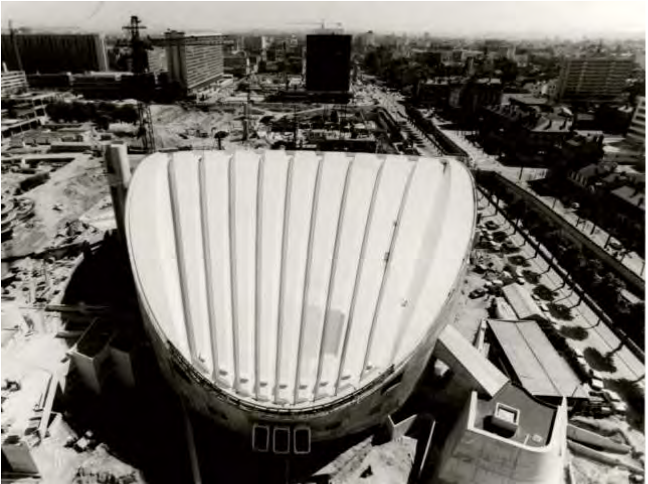
Figure 6 - Auditorium Maurice Ravel, vue sur le toit, et chantier de la Part-Dieu (1974). 3272WM378.

Les dossiers disponibles sur cet intervalle sont donc surtout liés aux bâtiments et à leur construction :