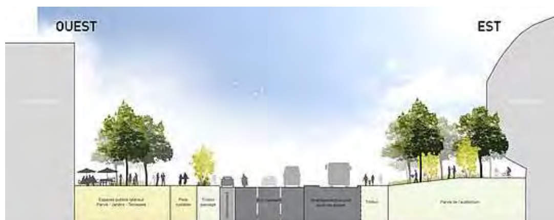
Figure 8 - L'aménagement de la rue Garibaldi vu en coupe © Passagers des Villes.

Conçue pendant la première phase d'aménagement de Part-Dieu comme une « autoroute urbaine » pour faciliter le trafic automobile en centre-ville, la rue Garibaldi est pensée dans le projet Part-Dieu comme un axe majeur de requalification. La réhabilitation de la rue Garibaldi a pour but l'apaisement de la circulation automobile en réduisant le nombre de voies de circulation tout en développant l'usage des modes doux comme le vélo ou la circulation piétonne.