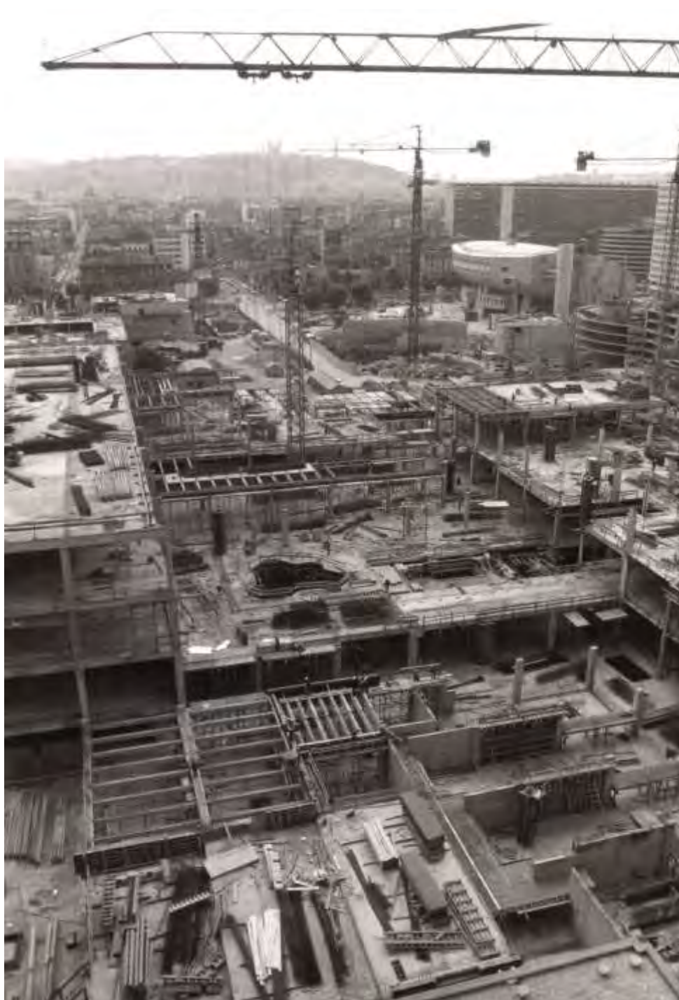
Figure 5 - Chantier du centre commercial de la Part-Dieu en 1974. La bibliothèque municipale avait été inaugurée en 1972, suivie de l'Auditorium. Archives du Grand Lyon, 3004WM010. © Métropole de Lyon - TABEY Jean-Paul.

C'est l'époque du style que l'on appelle le « Brutalisme », marqué par l'usage du béton brut dont le meilleur exemple dans le quartier reste l'Auditorium. Les formes sont géométriques et anguleuses avec l'usage récurrent de matériaux tel que la brique, le verre, l'acier, et les pierres grossièrement taillées.