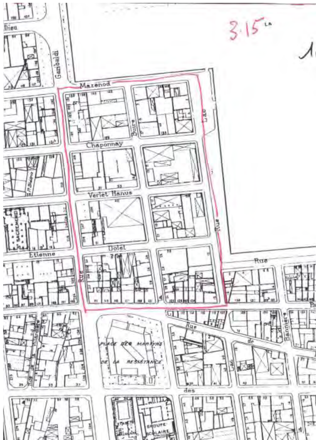
Figure 3 - Plan de situation du futur quartier de l'Hôtel de Communauté (1960). Archives du Grand Lyon, 3004WM014.

La SERL lance alors un concours de projets. Le lauréat retenu en 1961 est « l'opération Moncey » qui comporte un programme massif de logements. Le dessin du plan, assuré par les architectes Perrin-Fayolle, Sillan et Zümbrunnen, comporte 2600 logements dans l'esprit de la Charte d'Athènes publiée par Le Corbusier. Le plan-masse approuvé en 1962 présente huit grandes barres hautes de 50 mètres, groupées deux par deux et bordées de larges jardins et d'équipements. C'est l'époque de la construction des barres de logements Desaix, du Lac et Zümbrunnen. On y trouve aussi les