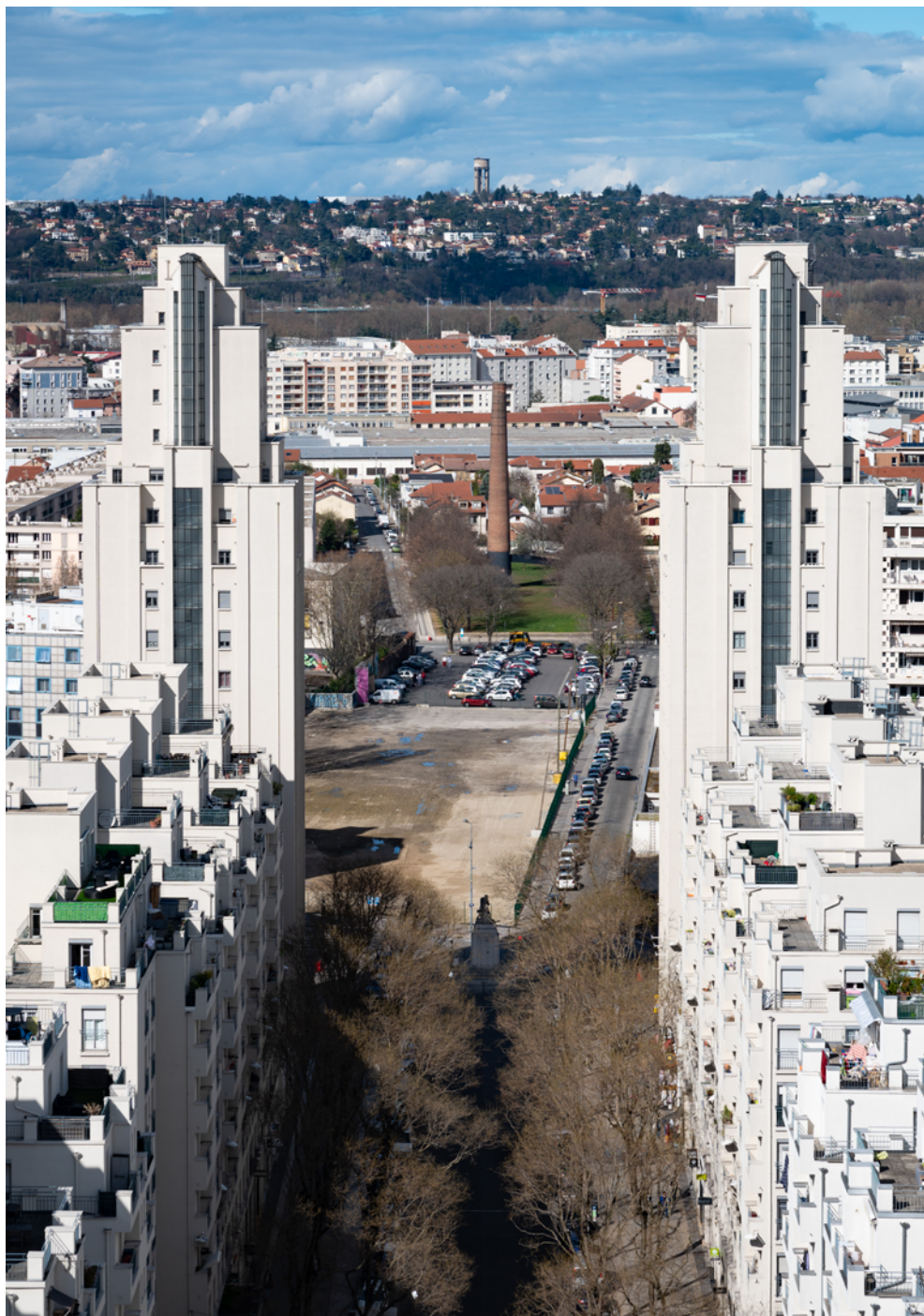
▲ Perspective avenue Henri-Barbusse

Jonction entre l'existant et le projet, cette avenue symbolise la colonne vertébrale du centre-ville de Villeurbanne.