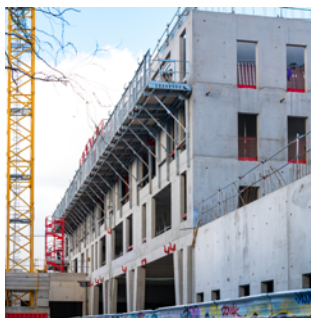
▲ Immeuble Prélude chantier en mars 2020 Maitrise d'ouvrage : Rhône Saône Habitant et Est Métropole Habitat Architecte : Michel Guthman Architecture & Urbanisme (MG-AU)

L'immeuble Prélude c'est aussi 67 logements sociaux décomposés en 2 bâtiments, en plein cœur de l'opération.