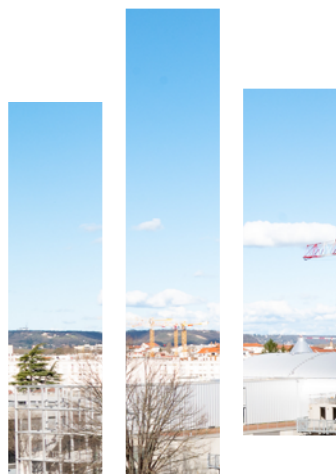
▲ Panorama des chantiers mars 2020

de vie dans la ville. Ce chapitre présente les premiers bâtiments ouverts au public, les aménagements provisoires réalisés à ce jour et les chantiers en cours.