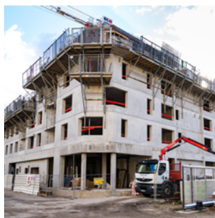
▲ Lycée Pierre-Brossolette chantier en mars 2020 Maitrise d'ouvrage: Région AURA Architecte: Atelier Nicolas Michelin & Associés (ANMA)