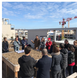
▲ Immeuble Néopolis 7-9-11 rue Hippolyte Kahn, Villeurbanne Architecte : l'Atelier Régis Gachon Architectes Promoteur : UTEI

Néopolis est ainsi le premier immeuble de logements à sortir de terre. Il se compose de 53 appartements, d'une terrasse collective et d'un jardin potager spacieux et surélevé. Avec les beaux jours, séances de jardinage et apéros entre voisins rythmerons ses toits.