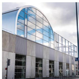
▲ Complexe sportif Alexandra David-Neel 100 rue Francis-de-Pressensé, Villeurbanne Architecte : ANMA

Il proposera bien d'autres disciplines et complètera l'offre sportive du quartier. Ses portes ouvriront au printemps.