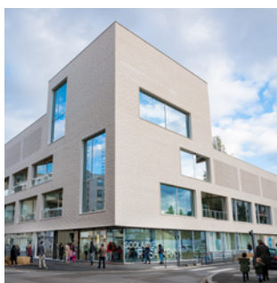
▲ Groupe Scolaire Rosa Parks 138 rue Francis de Pressensé, Villeurbanne Architecte : Brenac & Gonzales