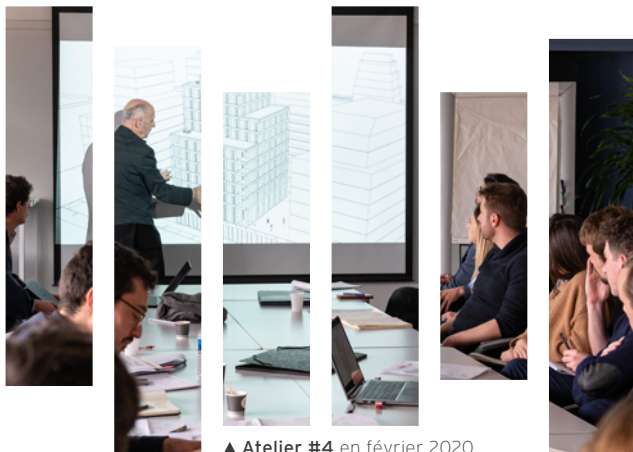
▲ Atelier #4 en février 2020