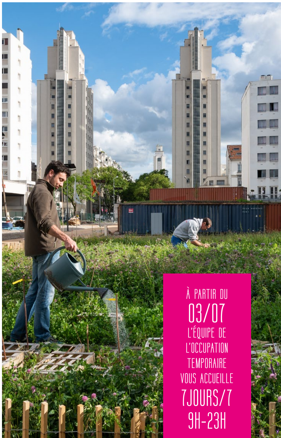
▲ Potager Gratte-Terre (occupation temporaire)

À PARTIR DU 03/07 L'ÉQUIPE DE L'OCCUPATION TEMPORAIRE VOUS ACCUEILLE 7 JOURS/7 9H-23H