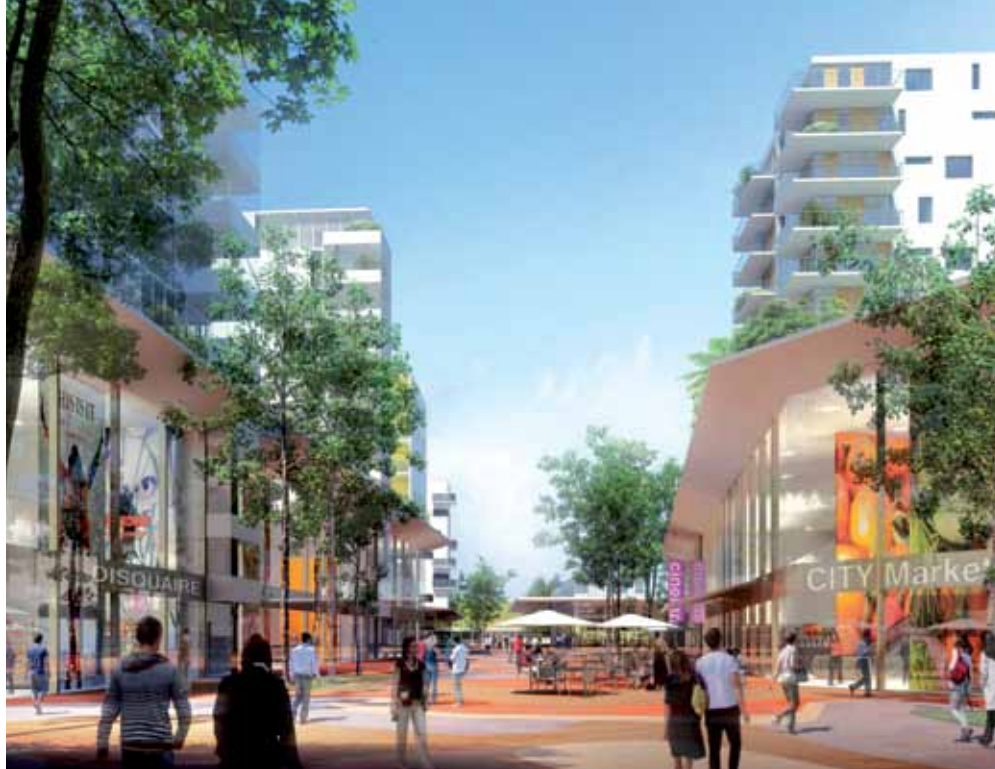
La place centrale - Illustration d'ambiance