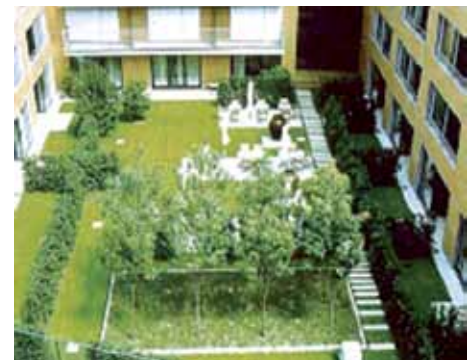
Exemple de jardins suspendus.