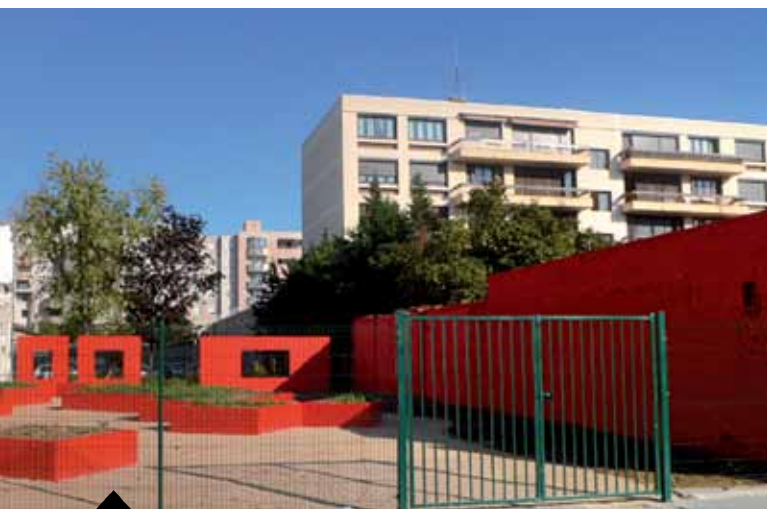
La friche rouge - Rue Léon -Chomel