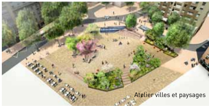
Atelier villes et paysages

Le concept d'aménagement repose sur une nouvelle répartition des espaces : le cœur de la place et le «cours des Tapis».