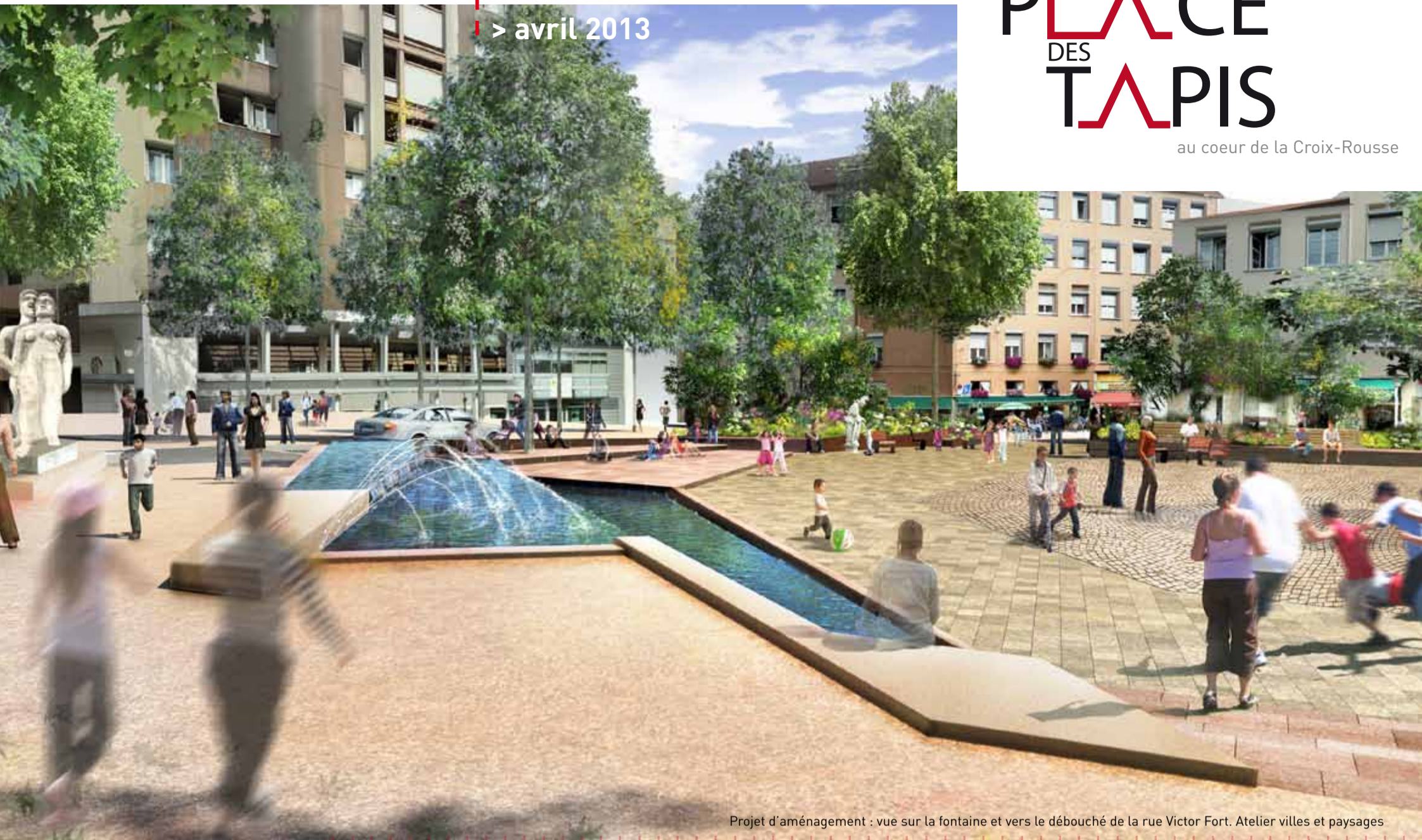
Projet d'aménagement : vue sur la fontaine et vers le débouché de la rue Victor Fort. Atelier villes et paysages