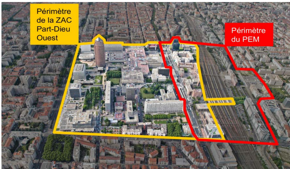
Figure 1 : périmètre du projet de ZAC Part-Dieu Ouest et du pôle d'échange multimodal qui forment pour leurs maîtres d'ouvrage une unité fonctionnelle

Le projet de réalisation de la ZAC de La Part-Dieu Ouest s'inscrit dans une vaste opération d'urbanisme intitulée « Projet Lyon Part-Dieu » visant à redynamiser le quartier de la Part-Dieu situé dans l'ouest du centre ville de Lyon. Le projet Lyon Part-Dieu couvre 177 ha incluant la ZAC Part-Dieu ouest, la ZAC Part-Dieu sud et le pôle d'échanges multimodal (PEM) autour de la gare de Lyon Part-Dieu.