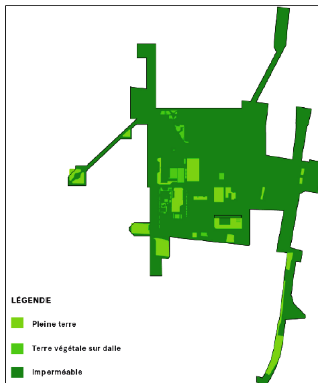
Figure 3 : Espaces imperméables, recouverts de terre et perméables de la ZAC Part-Dieu ouest

Le sol est fortement imperméabilisé avec une aire perméable de 3,1 ha correspondant à seulement 8 % de la surface de la ZAC.