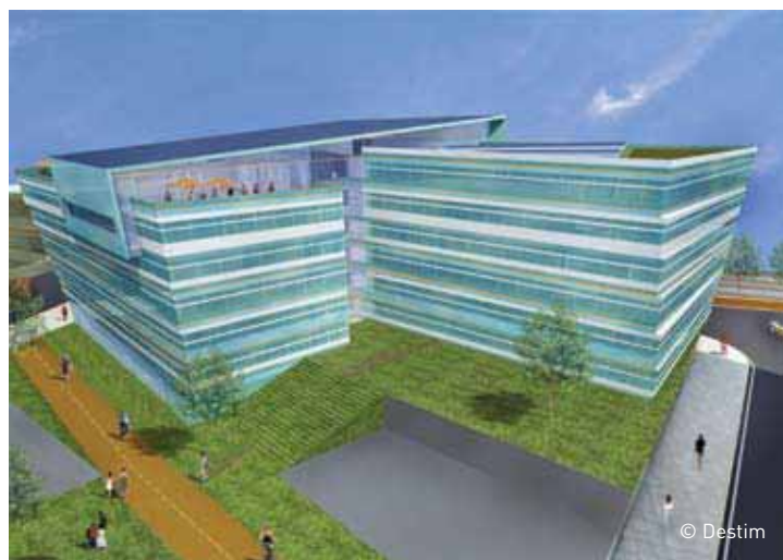
Le futur pôle de coopération et de finance éthique