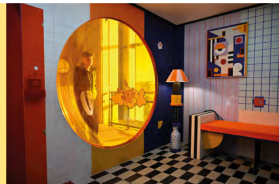
Cœuvre de l'exposition AiRT DE FAMILLE, avec réemploi d'une coupole faisant précédemment partie du toit de la passerelle entre le centre d'échanges et la gare SNCF.