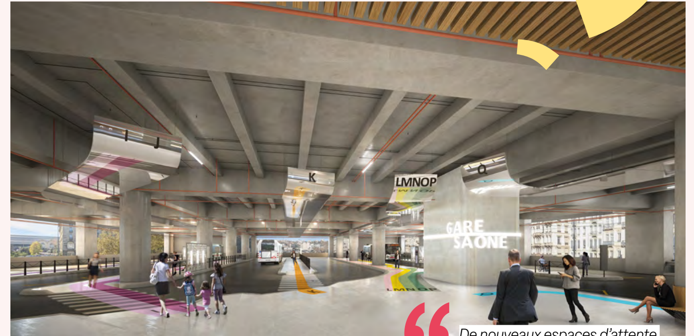
Perspective d'ambiance de l'espace d'attente de la gare bus TCL côté Saône après les travaux.

La Métropole de Lyon engage, à partir du 12 janvier 2026, un réaménagement complet de la gare bus TCL du centre d'échanges. Les travaux s'étendent jusqu'à début 2027.