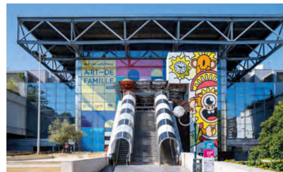
La façade aux couleurs de l'exposition AiRT DE FAMILLE.

Avant l'été, d'autres interventions sont prévues : rénovation de piliers du bâtiment, dépose du lustre monumental de la salle d'échanges, rénovation de deux premières trémies routières qui passent sous le centre d'échanges, réaménagement des parkings.