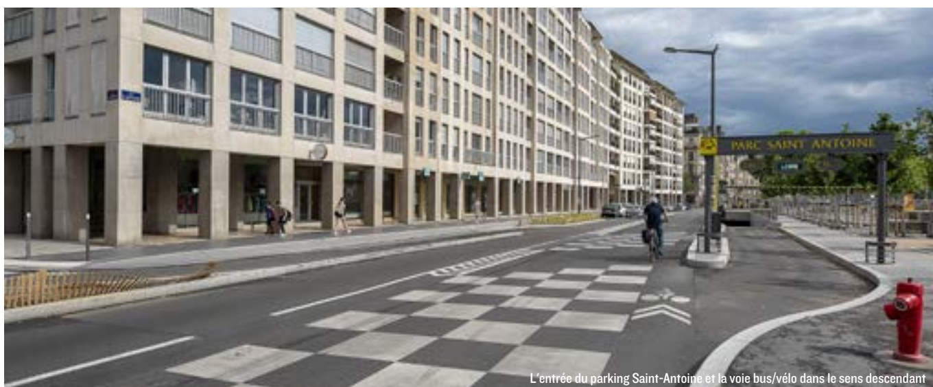
L'entrée du parking Saint-Antoine et la voie bus/vélo dans le sens descendant

Les travaux sur la place d'Albon sud sont terminés depuis décembre. L'aménagement de la place est totalement achevé, offrant aux riverains et aux visiteurs un espace de promenade qualitatif de la place Saint-Nizier jusqu'au quai. Au niveau de la rue des Bouquetiers, une piste cyclable bidirectionnelle a été aménagée. Ces adaptations vélos se sont faites dans la perspective de favoriser l'usage des modes actifs tout en réduisant la circulation automobile en Presqu'île.