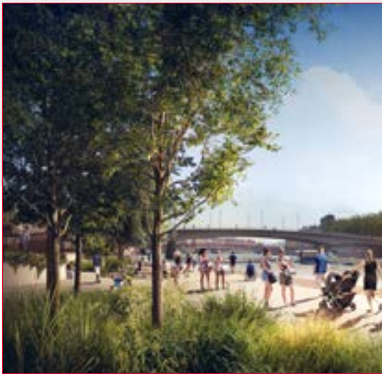
Vue de la végétation en quai bas et de la promenade au bord de l'eau

4 La végétation en quai bas sera inspirée des rives sauvages du Val de Saône avec des sortes d'îles végétalisées. Plus de 35 espèces différentes y seront plantées. Au total : 90 arbres, 83 000 arbustes et 10 000 vivaces en feront l'espace le plus végétalisé du projet des Rives de Saône !