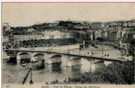
Photographie du pont du Change conservée dans les collections de la Bibliothèque municipale de Lyon.

❶ Des vestiges sont préservés en quai bas à la mémoire du pont du Change. Premier pont de Lyon, le pont du Change reliait d'un côté la rue Mercière et l'Église Saint-Nizier et de l'autre la place du Change au cœur du Vieux-Lyon. Il a ainsi joué un rôle stratégique dans le commerce dès le XIII e siècle. Le pont de Nemours lui a succédé au même endroit en 1842 ; ce sont ses vestiges qui sont intégrés aux aménagements. En quai haut, un belvédère fera écho à cet ancien axe marchant entre la Presqu'île et le Vieux-Lyon. Il permettra d'admirer un panorama unique sur la Saône et la colline de Fourvière.