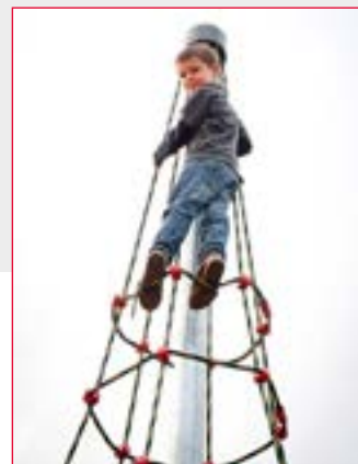
Aperçu de la pyramide de cordes

❷ Un square aire-de-jeu de 1200 m 2 prendra place sur la terrasse du niveau intermédiaire. Surélevée d'1,60 mètre par rapport au bas-port, elle sera protégée des crues décennales. Elle proposera deux espaces : un pour les 2-6 ans et un pour les 5-12 ans. On y trouvera une dizaine de jeux au total, parmi lesquels une grande toile d'araignée à escalader. 18 arbres y apporteront ombre et fraîcheur.