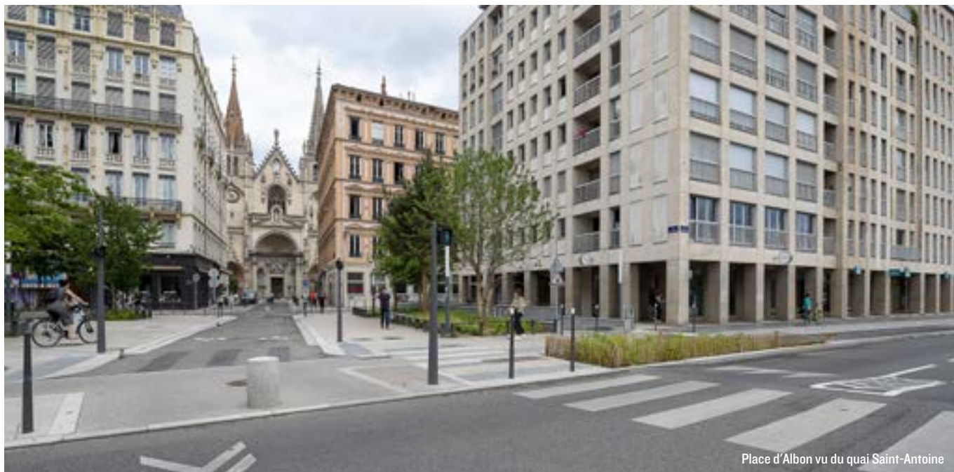
Place d'Albon vu du quai Saint-Antoine