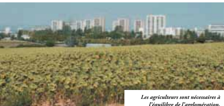
Les agriculteurs sont nécessaires à l'équilibre de l'agglomération.

porteurs de projets agricoles, qui sont ensuite orientés vers l'interlocuteur approprié à la spécificité du projet. Afin de simplifier les procédures d'installation, le Grand Lyon sert d'intermédiaire pour tout ce qui concerne les questions liées à l'urbanisme. Cette politique commence à porter ses fruits. Au cours des deux dernières années, une dizaine d'agriculteurs s'est installée dans le Grand Lyon. Horticulteurs, apiculteurs, maraîchers, céréaliers, maraîchers, éleveurs de chèvres ou de chevaux... ils ont essaimé aux quatre coins du territoire, de Rillieux-la-Pape à Saint-Priest, de Solaize à Poleymieux en passant par Limonest. Acteurs économiques, ils contribuent à l'entretien de notre cadre de vie... tout en nous régaland de leurs produits ! ■