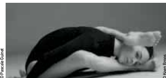
Sidi Larbi Cherkaoui - Toneelhuis Myth