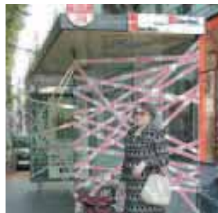
Olivier Chabanis Appropriation de mobilier urbain n°1, 2006