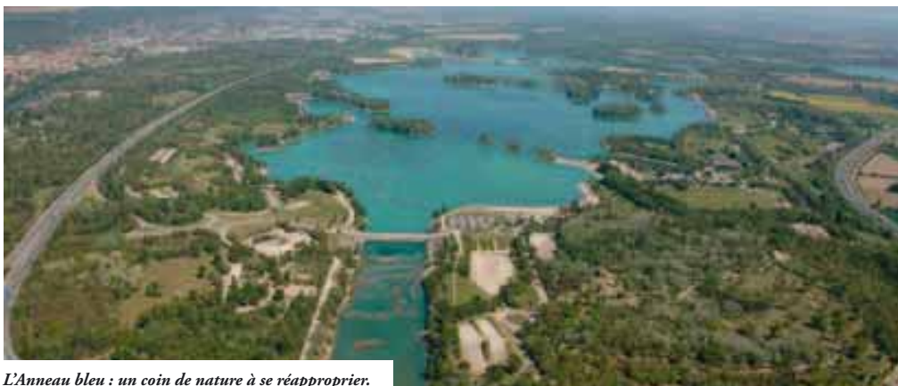
L'Anneau bleu : un coin de nature à se réapproprier.

NATURE Les acteurs publics et privés se penchent sur le berceau de l'Anneau bleu avec un vœu : créer un nouvel espace de loisirs dédié à la nature urbaine.