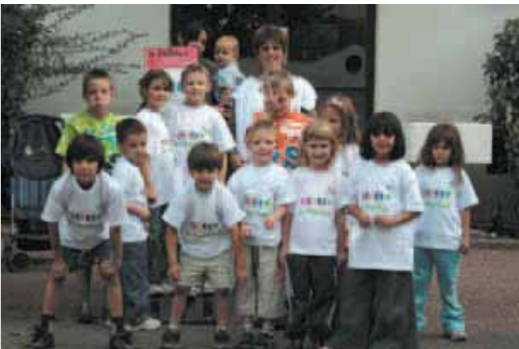
Plus sûr, plus sain, plus convivial... Pédibus a tout bon !

Pédibus n'a plus rien d'expérimental. Ce ramassage scolaire à pollution zéro a été adopté par une partie des petits Grands Lyonnais. Bel exemple d'action écocitoyenne.