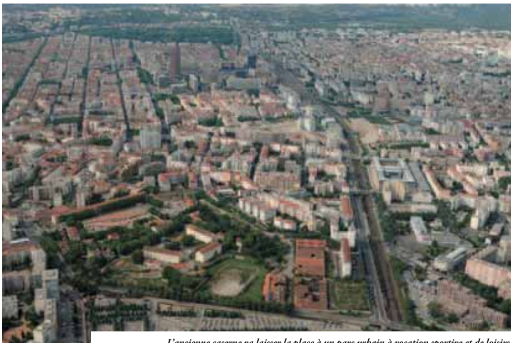
L'ancienne caserne va laisser la place à un parc urbain à vocation sportive et de loisirs.

NATURE Sur le site de l'ancienne caserne Sergent Blandan (Lyon 7 e ), un grand parc urbain de 17 hectares est appelé à accueillir des activités de loisirs et de détente.