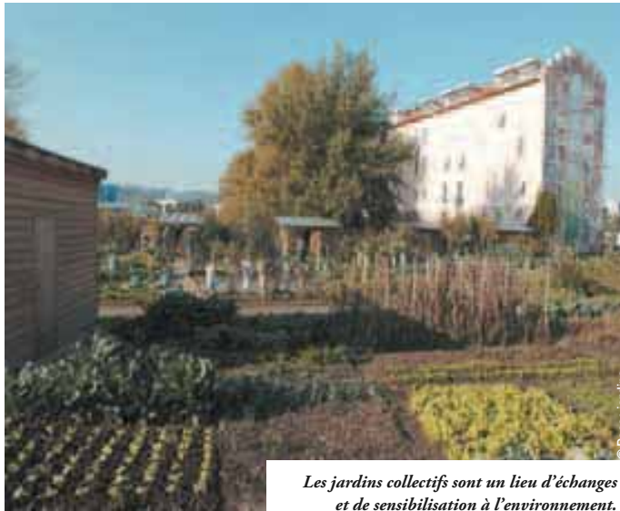
Les jardins collectifs sont un lieu d'échanges et de sensibilisation à l'environnement.

A u fil des dernières saisons, les jardins collectifs se sont multipliés et considérablement diversifiés dans le Grand Lyon, empruntant la forme de potagers en pieds d'immeubles, d'espaces à cultiver dans un objectif pédagogique ou d'insertion, ou même de carrés de verdure nomades destinés à meubler temporairement les friches urbaines. Définis comme des jardins « conçus, construits et cultivés par les habitants d'un quartier ou d'un village », les jardins collectifs ont le vent en poupe : depuis 1999, sous l'égide du Grand Lyon, l'association « Le Passe-jardins » a ainsi accompagné une soixantaine de projets de création, soit une dizaine par an en moyenne. Et