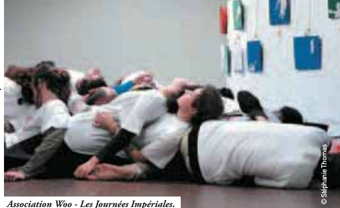
Association Woo - Les Journées Impériales.