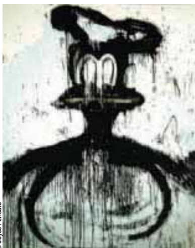
Parker's box (us) - Joyce Pensato