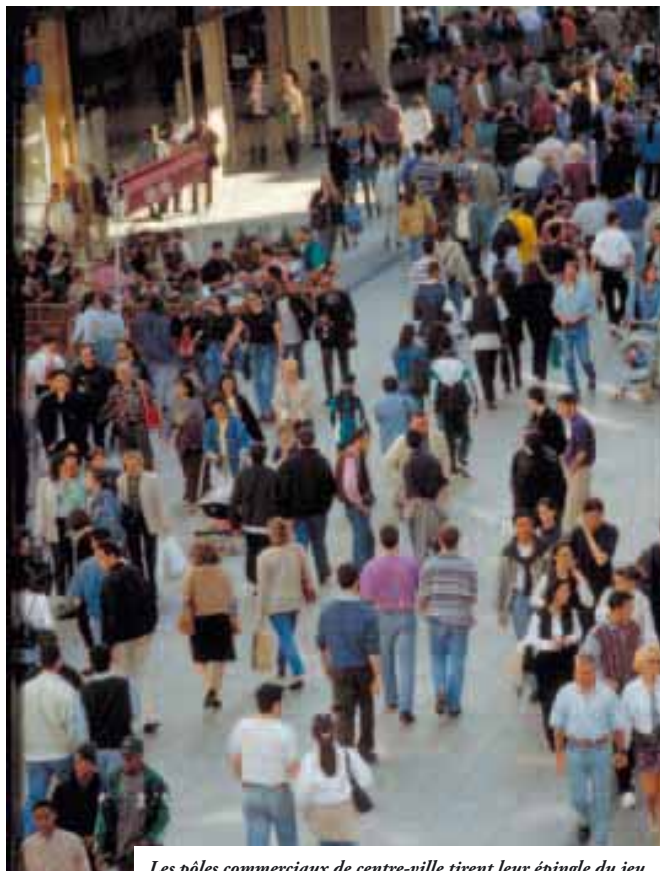
Les pôles commerciaux de centre-ville tirent leur épingle du jeu.

Depuis la dernière édition, datée de 2001, la part des hypermarchés s'est légèrement érodée tandis que le rééquilibrage de l'offre entre les centre-villes et la périphérie se confirme. L'ensemble Part-Dieu-Presqu'île arrive ainsi en tête des pôles commerciaux, talonné par celui de la Porte des Alpes. Autre nouveauté, l'enquête, qui prend en compte les moyens de déplacements utilisés par les consommateurs pour faire leurs achats, mesure une progression sensible des transports en commun et voit le vélo entrer au palmarès. Dans l'hypercentre, il contribue à hauteur de 1,6 % au chiffre d'affaires réalisé, ce qui représente tout de même 55 millions d'euros sur les 11 milliards d'euros de potentiel de consommation en 2006 !