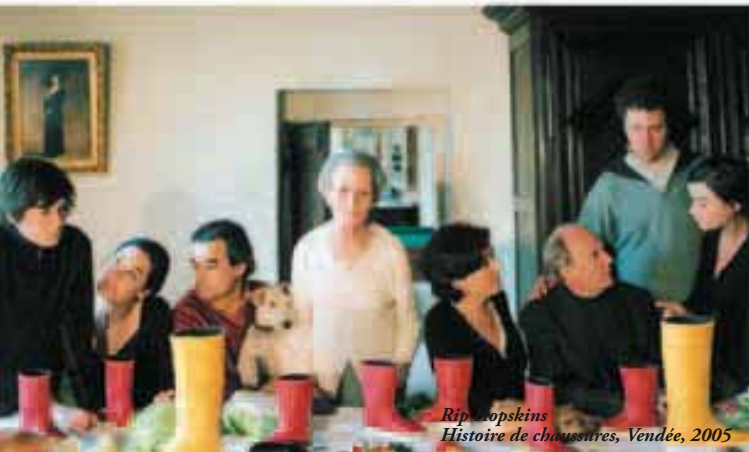
Rip-topskins Histoire de chaussures, Vendée, 2005

CRÉATION Arts plastiques, danse, spectacle, cinéma, théâtre, photographie, vidéo, musique, design... en Résonance avec la Biennale d'Art Contemporain, plus de 120 manifestations recouvrant le champ tout entier de la création animent l'agglomération.