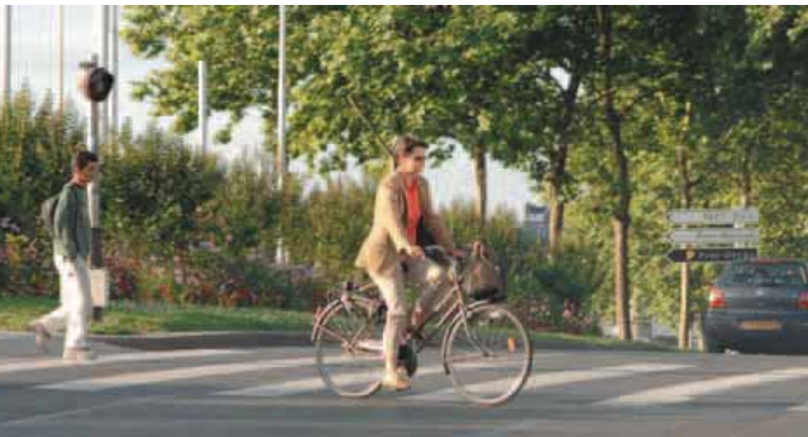
Les habitudes de déplacement des citoyens se modifient et font la part belle aux modes doux.

Selon l'Enquête Ménages Déplacements 2006, les habitudes de déplacement des citoyens évoluent, avec une diminution de l'usage de la voiture au profit des transports en commun et des vélos. Un pas décisif pour l'air ambiant !