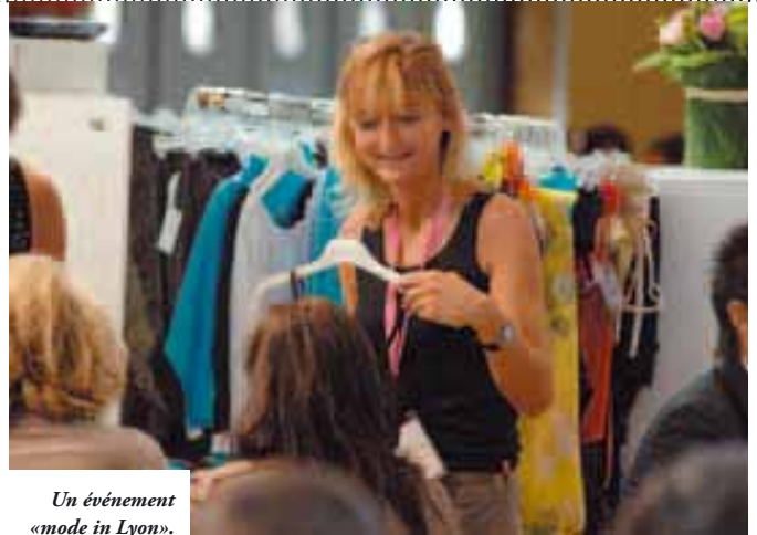
Un événement «mode in Lyon».

De plus en plus internationaux, ces deux salons font figure de rendez-vous incontournables pour les fabricants venus présenter leurs collections été 2008 en lingerie et beachwear et leurs nouveautés tissus pour l'automne-hiver 2008-2009. Une véritable plate forme d'effervescence créative et de rencontres, en particulier pour les tisseurs et créateurs régionaux, mais aussi une formidable vitrine internationale pour Lyon en tant que ville de tourisme d'affaires. L'an dernier, les deux salons, regroupant 930 marques de lingerie et de beachwear et 400 tisseurs, ont attiré 19 000 visiteurs, dont 62 % en provenance de