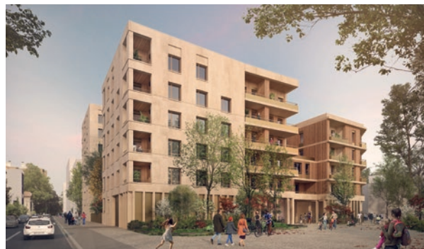
© Atelier de Ville en Ville / Sample Architectures

Calendrier : lancement commercial au 1 er trimestre 2026, démarrage travaux au 3 ème trimestre 2026 et livraison en 2028.