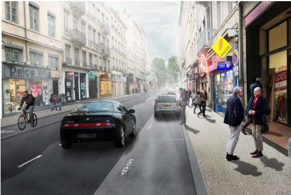
Le cours Vitton aménagé fin 2019