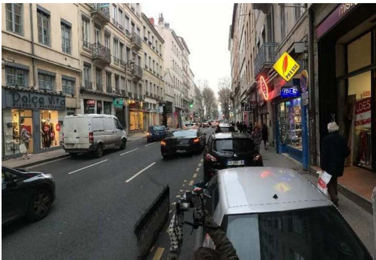
La situation actuelle cours Vitton