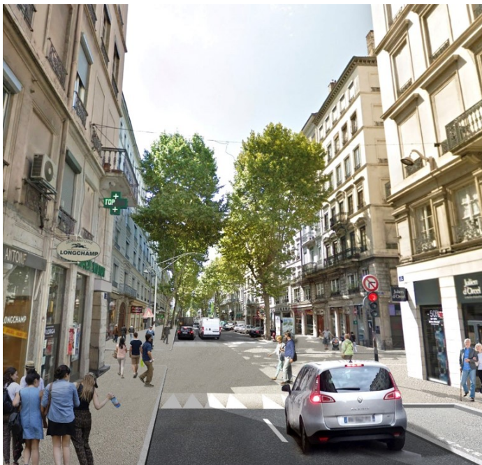
Aménagement en zone 30 avec plateau surélevé

Ce tronçon prioritaire sera aménagé en zone 30 avec la création de 2 plateaux surélevés : un premier à l'entrée de la zone 30 à hauteur du carrefour Vitton-Tête d'Or et un second à la sortie de cette zone 30 nouvellement créée, au niveau du tronçon Vitton-Garibaldi.