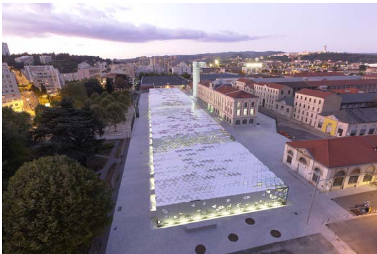
La Platine © LIN Finn Geipel + Giulia Andi

En amont, la Cité du Design organisera un atelier de sensibilisation au design à Saint-Etienne. Conduite en juillet 2015, cette action aura pour objectif de promouvoir l’offre de la Cité du Design et de permettre aux prescripteurs présents de faire la promotion de la convention d’affaire grâce à une connaissance plus fine des enjeux du design et des possibilités d’accompagnement adaptées à chaque type d’entreprise.