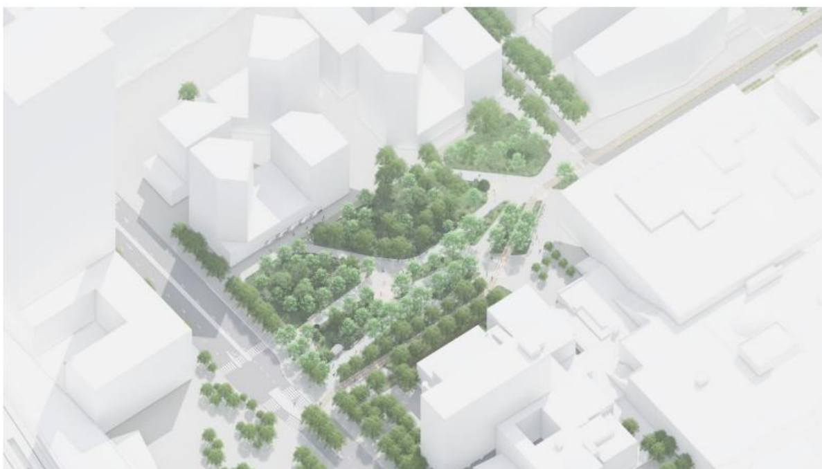
Perspective d'intentions du projet (phase 1 & 2)