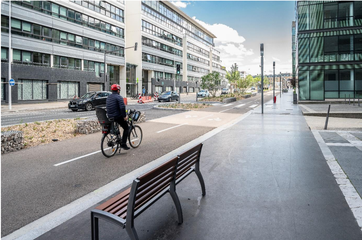
La Voie Lyonnaise 2 au niveau du boulevard Marius Vivier-Merle.