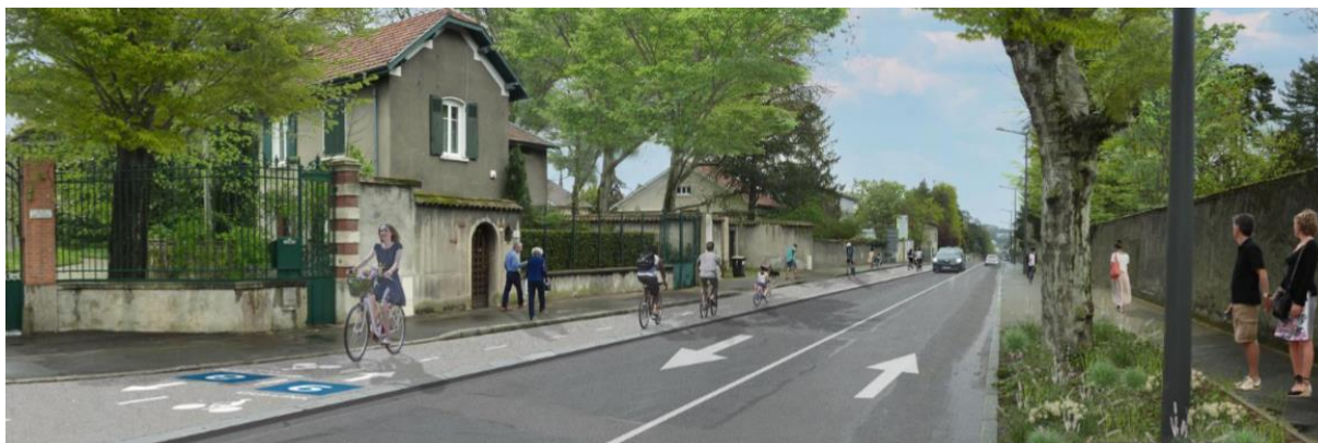
Perspective de la VL6 sur l'avenue Georges Clémenceau à Saint-Genis-Laval