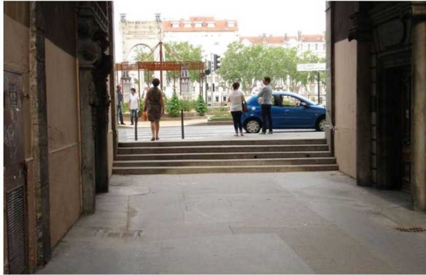
La situation actuelle