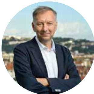
Bruno BERNARD , président de la Métropole de Lyon et de SYTRAL Mobilités

La Métropole de Lyon et SYTRAL Mobilités déploient un plan d'actions afin de développer un réseau de bus performant, en améliorant les conditions de circulation des bus.