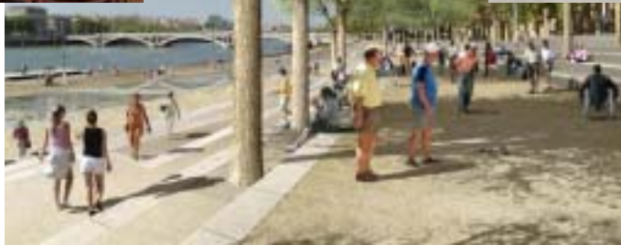
Le jeu de boules