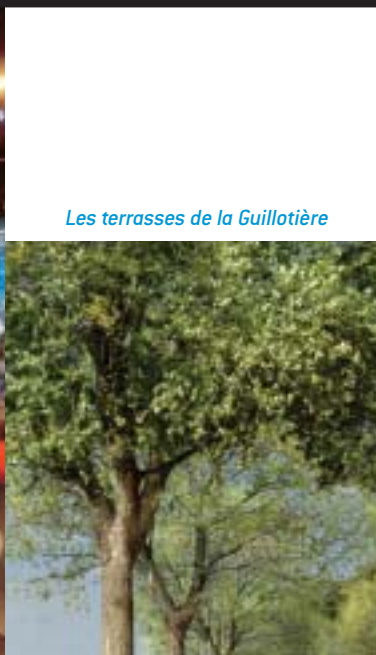
Les terrasses de la Guillotière