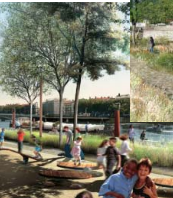
Les jeux de la passerelle du collège