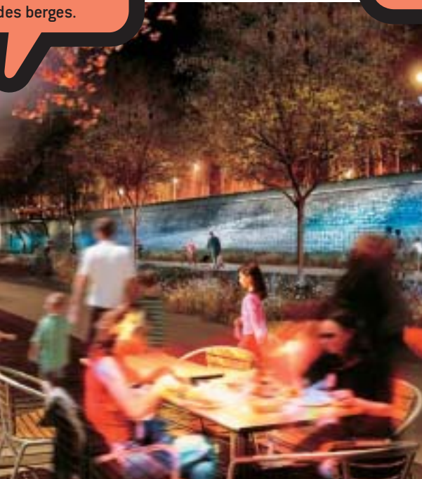
Vue de nuit

En aval de la prairie du Rhône, de part et d'autre du pont de la Guillotière, de larges terrasses en gradins sont développées sur ce site emblématique pour offrir une perspective panoramique unique sur le fleuve et la ville. En lien avec les quartiers et les nouvelles places Jutard et Raspail, ces terrasses animées, notamment par des jeux de boules, s'étagent régulièrement, avec des surfaces plantées d'arbres, des rampes et des escaliers. Au pied des terrasses, un grand bras d'eau courante apportera de la fraîcheur durant l'été. A l'aval du pont de la Guillotière, une large terrasse accueille deux bowls de skate et un terrain multisport pour les sportifs en herbe.