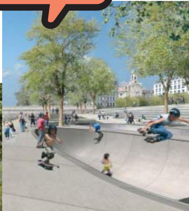
Le bowl de skate