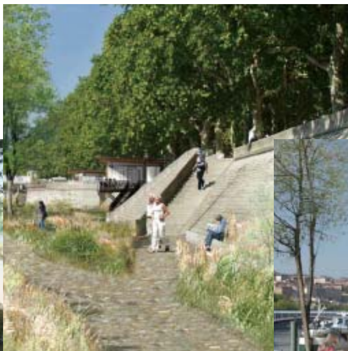
La rive habitée

A l'aval du pont Morand, les équipements de skate/roller sont confirmés par le développement d'une aire de street. De part et d'autre de la passerelle du collège, deux nouvelles aires de jeux pour les jeunes enfants sont développées autour du thème du bois et de l'eau avec possibilité d'accès par un toboggan installé contre le mur de perré.