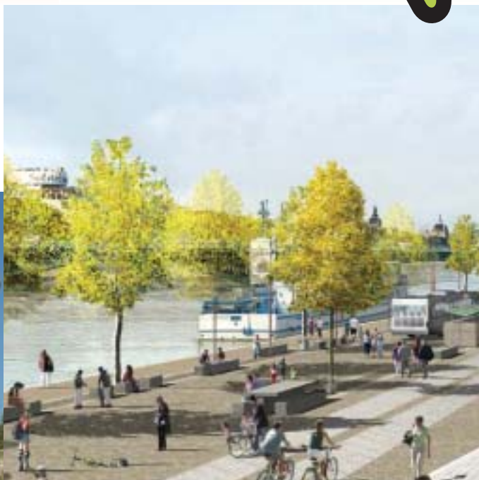
Le port de l'université