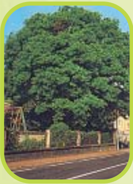
Sophora du Japon ou sophora botanica