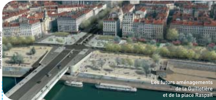
Les futurs aménagements de la Guillotière et de la place Raspail