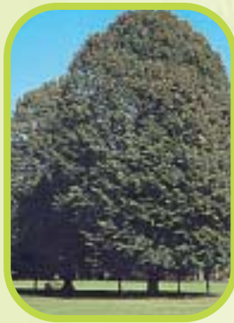
Tilleul ou tilia