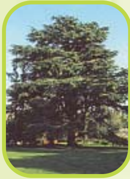
Cèdre ou cedrus