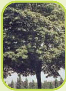
Érable ou acer