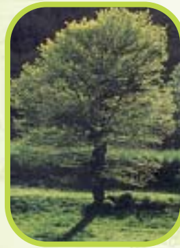
Orme ou ulmus