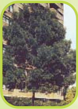
Frêne ou fraxinus