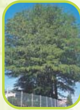
Févier ou gleditsia