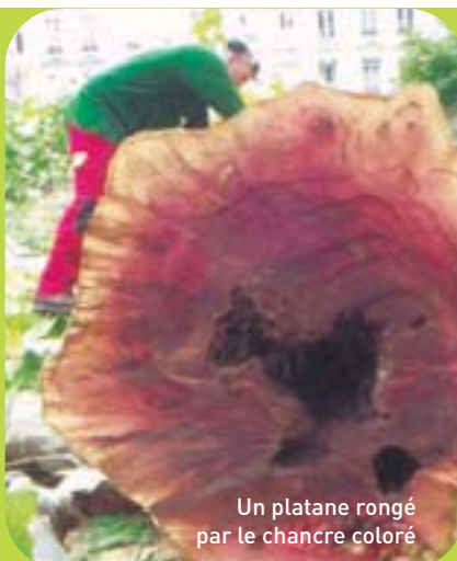
Un platane rongé par le chancre coloré