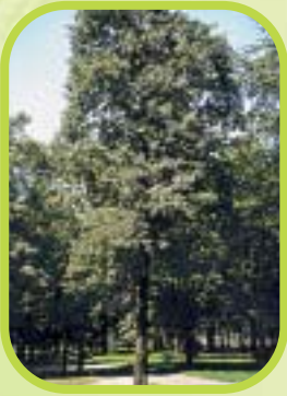
Aulne ou alnus