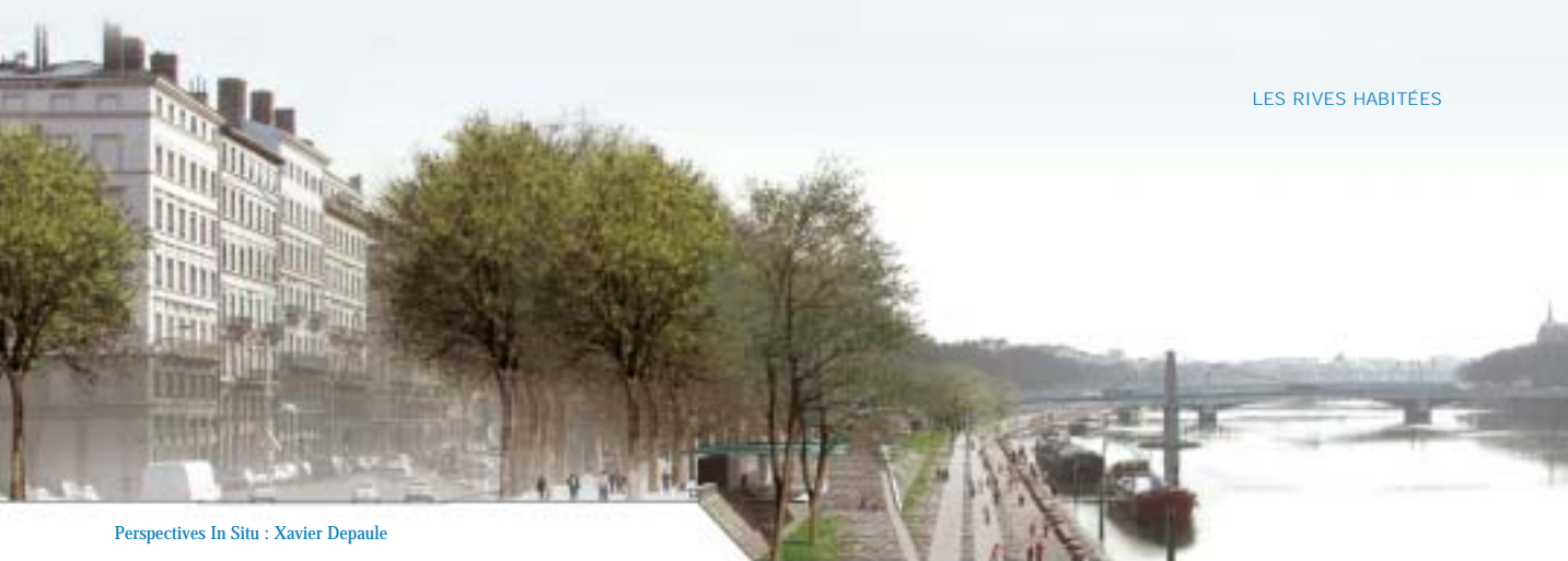
Perspectives In Situ : Xavier Depaule