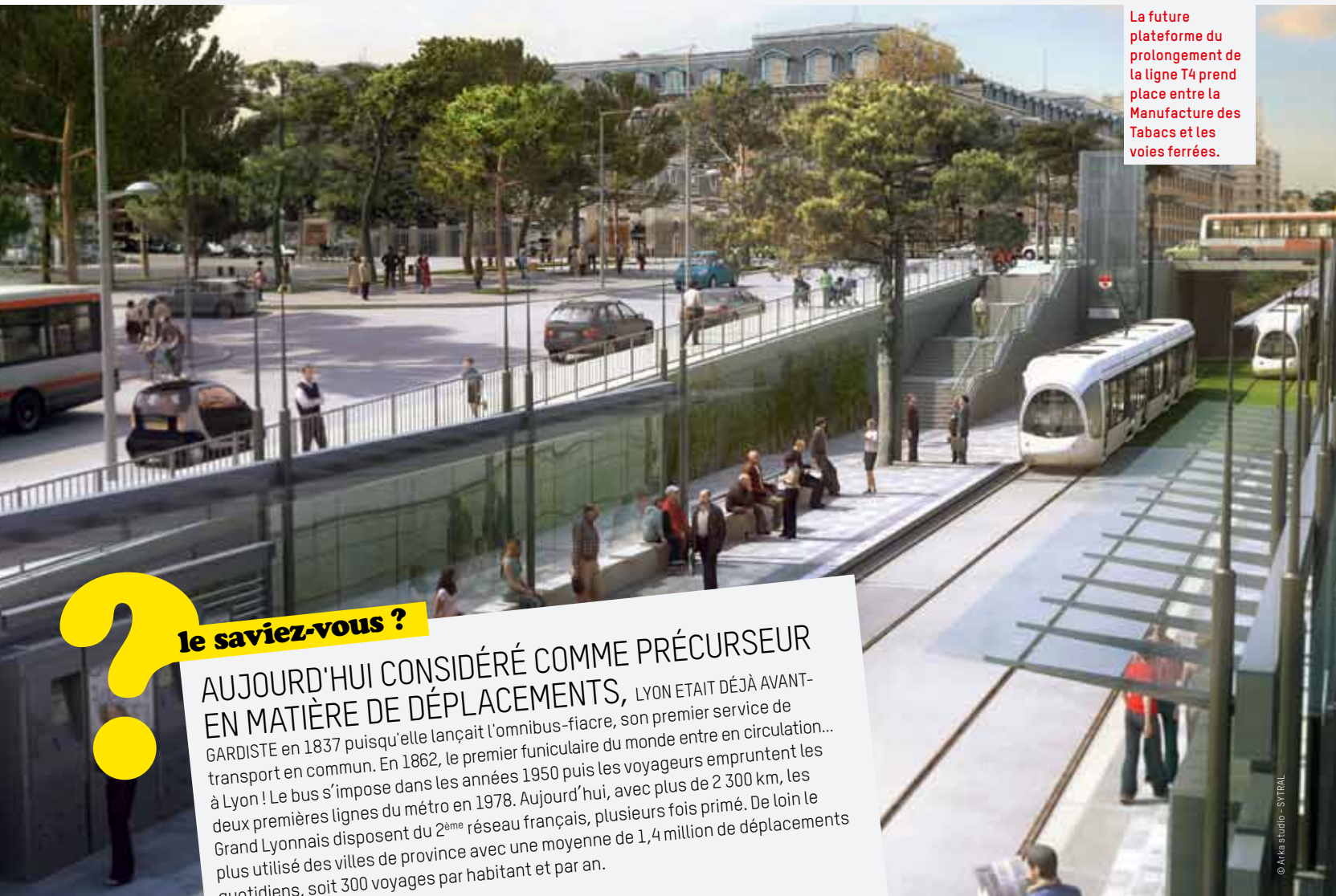
La future plateforme du prolongement de la ligne T4 prend place entre la Manufacture des Tabacs et les voies ferrées.

En ville, la question des déplacements s'impose à chacun. Le Grand Lyon innove, faisant rimer transports avec liberté... Il a inventé Vélo'v et fait éclore une vraie communauté de Vélo'veurs, développé et optimisé le réseau des transports en commun, et encouragé le déploiement des offres d'auto-partage. Dernières nées, les voitures en libre-service de Car2go. Une première en France ! La ville elle-même se dote de nouveaux ponts et passerelles pour faciliter la mobilité. Résultat : c'est plus facile, plus économique, plus chaleureux et plus respectueux de la planète !