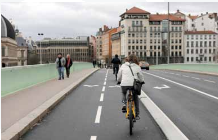
30 à 40 km de pistes cyclables sont aménagés chaque année par le Grand Lyon.

Largement adoptée par les 45 000 abonnés recensés en moyenne par semaine, les 4 000 bicyclettes rouges installées sur les 343 stations Vélo'v du Grand Lyon se sont taillées la part du Lyon dans les habitudes de déplacements et nous réconcilient avec la petite reine, qu'elle soit traditionnelle ou dotée d'une assistance électrique.