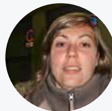
FLORENCE 24 ans, demandeuse d'emploi

« Prendre un Vélo'v est désormais bien plus rapide : les écrans défilent plus vite, le tactile s'est amélioré et on peut emprunter un vélo en simultané grâce aux bornes à double entrée. J'effectue mes trajets quotidiens à vélo, avec le mien lorsque je fais un aller-retour et à Vélo'v en cas d'aller simple. Quand la météo n'est pas très clémente, j'opte pour le métro ou le bus. »