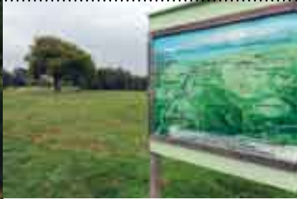
Les 115 hectares du Domaine de Lacroix-Laval offrent de multiples possibilités de loisirs.

Quant au Centre d'initiation à la nature (CIN) du Grand Moulin, implanté dans les bois et champs franchevillois sous l'égide de la Maison Rhodanienne de l'Environnement, il s'affirme comme un site de découverte de l'environnement très apprécié. Stages, ateliers et sorties nature rythment les saisons. Au programme de décembre : observation des oiseaux de l'hiver ou reconnaissance des insectes. La commune de Saint-Genis-les-Ollières, pour sa part, a initié un projet nature en 1994 afin de préserver les vallons du Ribes et de ses affluents. Un circuit de promenade, un sentier à vocation pédagogique et un inventaire de la faune et de la flore ont vu le jour. ■