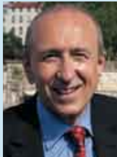
Président du Grand Lyon.