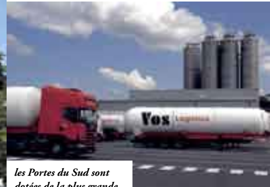
les Portes du Sud sont dotées de la plus grande zone d'activités de l'agglomération : la ZI Lyon Sud-Est.