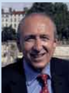
Président du Grand Lyon.