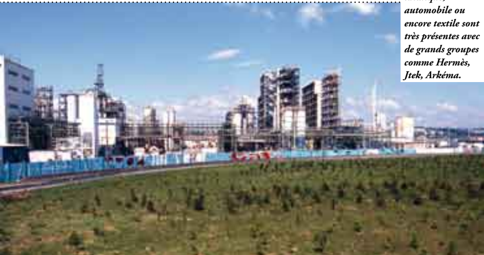
Les industries chimique, automobile ou encore textile sont très présentes avec de grands groupes comme Hermès, Jtek, Arkéma.