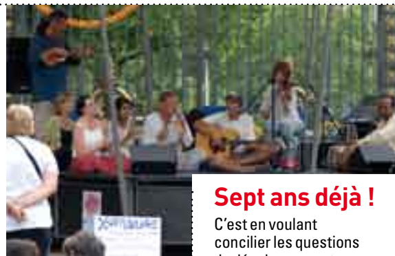
Arbre à palabres et personnalités éminentes : tout le principe des Dialogues...