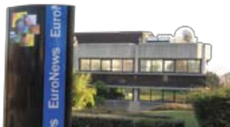
Techlid à Limonest, s'étend sur sept communes.

implantation et couvrant tous les champs de la vie d'une PME : de l'accompagnement de projets à la collecte sélective de déchets industriels banals. L'ambition est de pérenniser et d'accompagner l'activité de ces entreprises tout en les intégrant au développement du territoire. Solidarité, respect de l'environnement... autant d'engagements pris par les locataires de Techlid qui trouvent un écho favorable dans les communes concernées, soucieuses d'allier performance économique et qualité de vie. À ce titre, de nombreuses associations interviennent auprès des élus afin d'inciter au retour des petites exploitations agricoles et au développement des transports en commun ; notamment le projet ferré de Réseau Express de l'Aire urbaine Lyonnaise (REAL). ■