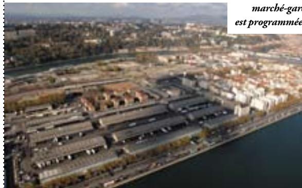
La démolition de l'ancien marché-gare est programmée.

www.laconfluenceonendiscute.fr Du mercredi au samedi, de 14h à 18h30, Maison de la Confluence, 102 cours Charlemagne, Lyon 2 e .