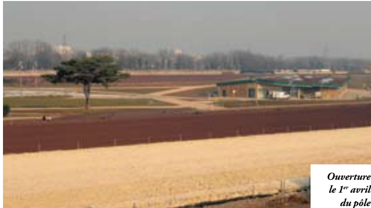
Ouverture le 1 er avril du pôle commercial et de loisirs.

Côté consommation, les moyennes surfaces et boutiques spécialisées proposent 40 000 m 2 dédiés aux produits de décoration, d'équipement de la personne, de culture, de bricolage et jardinage et de sport. Après leurs emplettes, les visiteurs pourront profiter des restaurants et du multiplexe cinéma Pathé (15 salles), ainsi que des loisirs extérieurs destinés à toute la famille sur les sept hectares du cœur de l'hippodrome devenu un immense terrain de jeux. En accès libre : une aire de