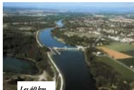
Les 40 km de berges du canal seront équipés de pistes cyclables.

En parallèle, EDF a réalisé en mars des travaux préventifs destinés à sécuriser la digue qui ont nécessité d'abattre les arbres responsables de son érosion. ■