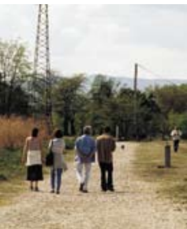
Lancement des travaux des berges fin 2009.