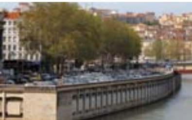
Démolition programmée du parking Saint-Antoine.