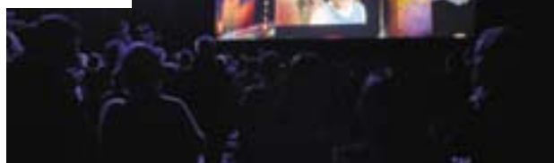
Le Hollywood lyonnais prend forme à Villeurbanne.