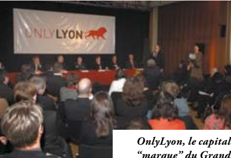
OnlyLyon, le capital "marque" du Grand Lyon à l'international.

► poursuivra son action en faveur de la vitalité des centres urbains. Les grandes lignes du nouveau Schéma Directeur d'Urbanisme Commercial (SDUC) sont très claires : priorité à une offre commerciale de proximité satisfaisante pour tous dans chaque commune de l'agglomération.