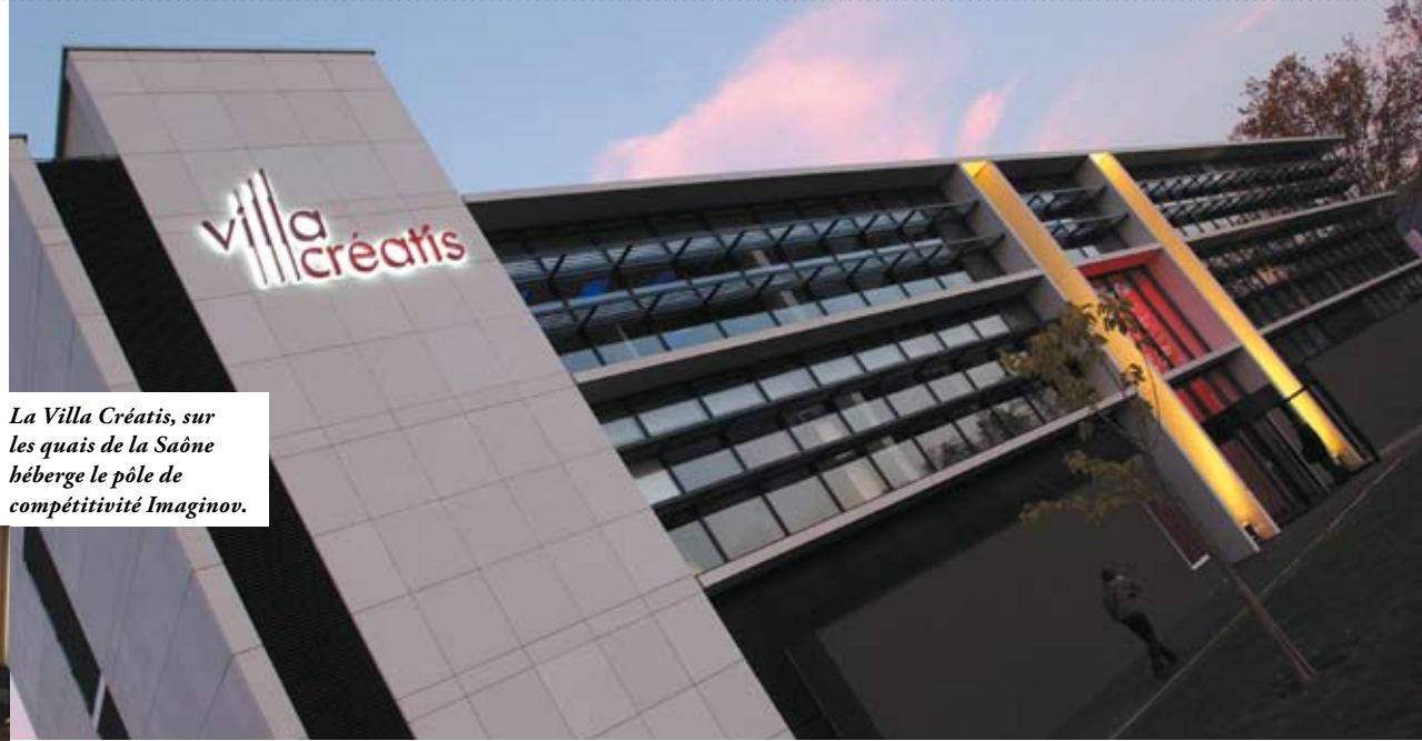
La Villa Créatis, sur les quais de la Saône héberge le pôle de compétitivité Imaginov.

Le nombre de m 2 de bureaux neufs qui seront mis sur le marché chaque année, dont 20 à 25 % à la Part-Dieu. Auxquels s'ajoutent 30 hectares en zones d'activités.