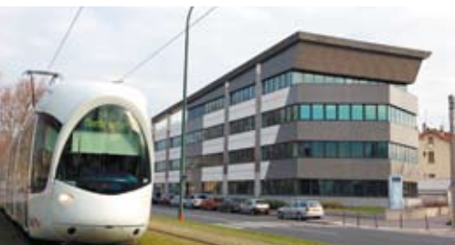
À Villeurbanne, un ensemble de bureaux dédié aux entreprises technologiques baptisé Einstein.

Comme on ne change pas un modèle qui marche, un tel dispositif sera reconduit dans les prochaines années avec un renforcement de l'action en faveur des secteurs économiques émergents, tels que cleantech où la région urbaine vise la place de leader européen.