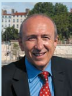
Président du Grand Lyon.