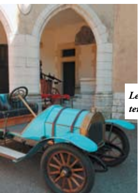
Le château de Rochetaillée, temple de la voiture ancienne.

des propositions culturelles et récréatives variées. Et si cette offre demande encore à se structurer, se développer et se faire connaître, il n'est pas trop tôt pour en profiter. En empruntant, par exemple, les sentiers d'interprétation aménagés par le Syndicat Mixte des Monts d'Or ou par les communes elles-mêmes, comme à Genay ou à Curis-au-Mont-d'Or en goûtant au charme d'une table d'hôtes ou en pénétrant les secrets de l'Histoire sur les traces de célébrités locales de la trempe du collectionneur d'automobiles Henri Malartre au château de Rochetaillée ou du scientifique André-Marie Ampère à Poleymieux. ■