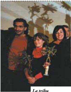
La tribu des "griffés" 2007.