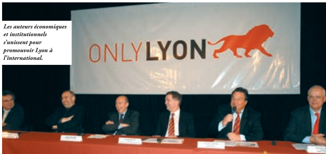
Les auteurs économiques et institutionnels s'unissent pour promouvoir Lyon à l'international.

RESEAU L'idée phare de la démarche OnlyLyon, c'est justement de raisonner « collectif ». Tous unis derrière un seul objectif : « vendre » Lyon.