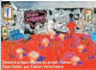
Dessins préparatoires au projet «Seven Days Hotel» par Fabien Verschaere

Une semaine « so british » avec la projection d'une douzaine de films et documentaires, dont certains inédits en France, venus d'outre-Manche. Le festival du cinéma britannique et irlandais s'ouvre également à de nouveaux horizons avec un concert de musique brit pop et une conférence-débat suite à la projection de The Queen de Stephen Frears. 04 78 93 42 65 www.lezola.com