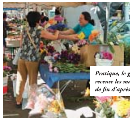
Pratique, le guide recense les marchés de fin d'après-midi

Le Rectangle de la place Bellecour dans sa version grand angle, du 2 mai au 2 juin, à l'occasion d'une exposition sur les grands projets de l'agglomération. L'idée est de montrer la façon dont le Grand Lyon évolue et gagne au fil du temps son statut de métropole internationale où il fait bon vivre et travailler. L'exposition se présente comme un focus sur les projets emblématiques du moment : la Cité internationale, Confluence, Carré de Soie, les berges du Rhône et la Duchère et les déplacements. Du mercredi au dimanche, de 10 h à 19 h, place Bellecour. Lire également nos articles des pages 9 à 13.