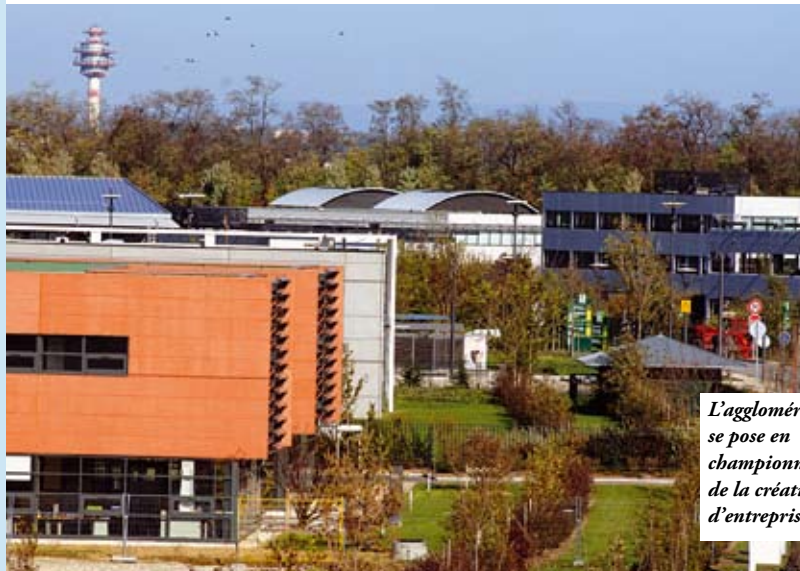
L'agglomération se pose en championne de la création d'entreprise.

Selon les chiffres clés de l'aire urbaine pour l'année 2004, tout juste publiés, la métropole bénéficie d'un retour de la croissance avec un taux de chômage en baisse de 6 % en un an pour s'établir à 9,4 % au 3 e trimestre 2004. Au niveau du commerce extérieur, les exportations affichent de bonnes performances et s'élèvent à 9 749 millions d'euros, soit une