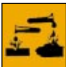
C - Corrosif