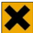
Xi - Irritant