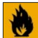
F+ - Extrêmement inflammable