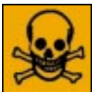
T+ - Très toxique

Les produits ménagers dangereux sont identifiables grâce aux symboles suivants :