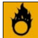
O - Comburant

Ces produits dangereux ne peuvent pas être collectés avec les ordures ménagères.