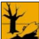
N - Dangereux pour l'environnement