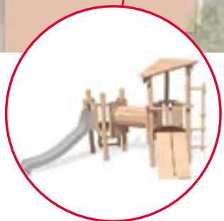
Module de jeux pour enfants avec toboggan

La ville de Villeurbanne installera au centre de la place un espace récréatif pour les enfants. Ces derniers pourront s'amuser sur des jeux à grimper et un toboggan. Les adultes ne seront pas en reste avec l'installation d'une aire de jeu de boules.