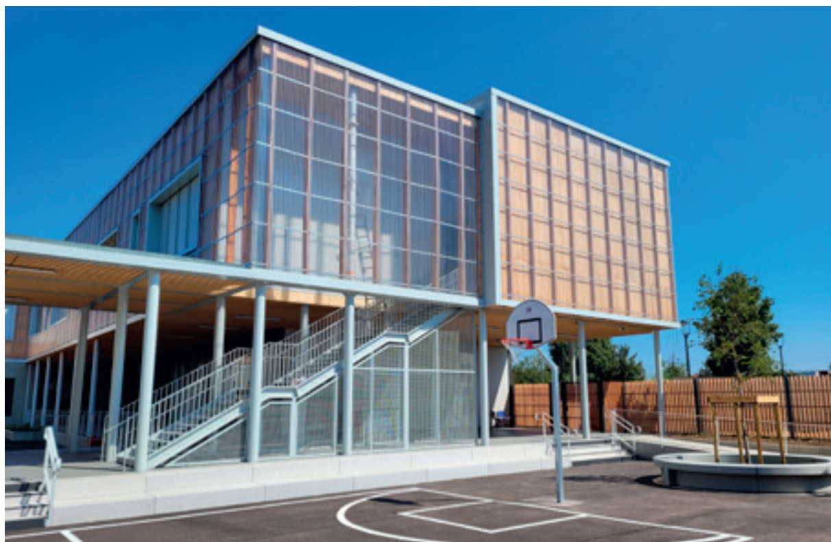
Le groupe scolaire Katherine Johnson