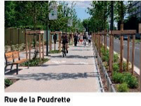
Rue de la Poudrette