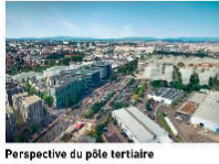
Perspective du pôle tertiaire