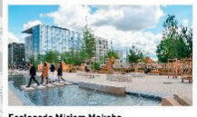
Espланаde Miriam Makeba