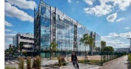
Adely - Siège Adecco