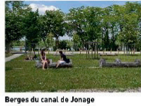
Berges du canal de Jonage