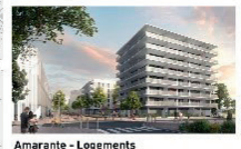
Amarante - Logements