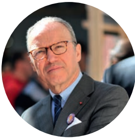
Pascal Mailhos préfet de la Région Auvergne Rhône-Alpes

« La requalification des cités Tase est un double symbole. Elle est d'abord la marque d'une continuité dans l'histoire de cette cité ouvrière emblématique, qui fait partie de notre patrimoine, et nous rappelle l'histoire de la ville de Vaulx-en-Velin autant que la place de l'industrie textile dans l'agglomération lyonnaise. En effet, le quartier demeure fidèle à sa vocation première : celle d'être un lieu de vie, d'accueillir des habitants, et de répondre aux enjeux du logement dans l'agglomération lyonnaise. Le caractère patrimonial des lieux est, quant à lui, respecté et mis en valeur par le projet. La requalification des cités Tase est aussi le témoignage de l'engagement de l'État, par son soutien au projet, en faveur de l'amélioration de l'habitat et du cadre de vie. Avec la ville de Vaulx-en-Velin et la Métropole de Lyon, l'État soutient la rénovation thermique des bâtiments, la création de logements abordables répondant aux besoins de leurs habitants, et la transformation du quartier. C'est la preuve que la ville évolue et change de visage, en répondant aux attentes de la population, aux enjeux de la transition écologique, et au nécessaire équilibre entre les territoires. »