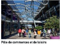
Pôle de commerces et de loisirs