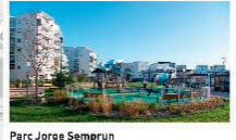
Parc Jorge Semprun