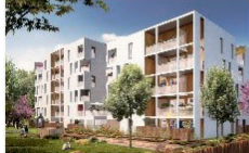
Pure Soie - Logements