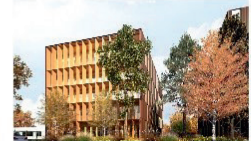
Eastwood - Tertiaire