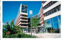
Organdi (lot 0) - Tertiaire