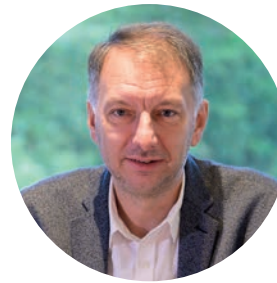
Bruno Bernard président de la Métropole de Lyon

« La requalification des cités Tase est un double symbole. Elle est d'abord la marque d'une continuité dans l'histoire de cette cité ouvrière emblématique, qui fait partie de notre patrimoine, et nous rappelle l'histoire de la ville de Vaulx-en-Velin autant que la place de l'industrie textile dans l'agglomération lyonnaise. En effet, le quartier demeure fidèle à sa vocation première : celle d'être un lieu de vie, d'accueillir des habitants, et de répondre aux enjeux du logement dans l'agglomération lyonnaise. Le caractère patrimonial des lieux est, quant à lui, respecté et mis en valeur par le projet. La requalification des cités Tase est aussi le témoignage de l'engagement de l'État, par son soutien au projet, en faveur de l'amélioration de l'habitat et du cadre de vie. Avec la ville de Vaulx-en-Velin et la Métropole de Lyon, l'État soutient la rénovation thermique des bâtiments, la création de logements abordables répondant aux besoins de leurs habitants, et la transformation du quartier. C'est la preuve que la ville évolue et change de visage, en répondant aux attentes de la population, aux enjeux de la transition écologique, et au nécessaire équilibre entre les territoires. »