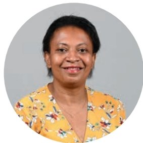
Hélène Geoffroy maire de Vaulx-en-Velin

« La ville de Vaulx-en-Velin agrège au travers de la diversité de son bâti plusieurs histoires, celle des fermes, celle des cités ouvrières et celle des grands ensembles.