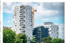
Existentiel (lot C1) - Logements