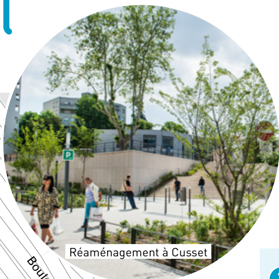
Réaménagement à Cusset