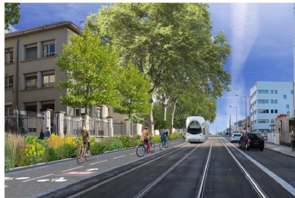
Perspective de la proposition d'une piste cyclable sur l'avenue Rockefeller.

Les riverains du quartier Montchat ont été rencontrés à plusieurs reprises par les élus de la mairie du 3 e arrondissement, de la ville de Lyon et de la Métropole de Lyon pour échanger sur le projet de mise en sens unique. Là aussi, sur leur proposition, il a été décidé de mettre en œuvre une phase d'expérimentation de 6 mois à partir de la fin d'année 2024 pour permettre d'évaluer les flux réels autour des axes concernés. Un atelier circulation est également prévu avec les riverains qui souhaitent limiter le report de trafic dans leur quartier.