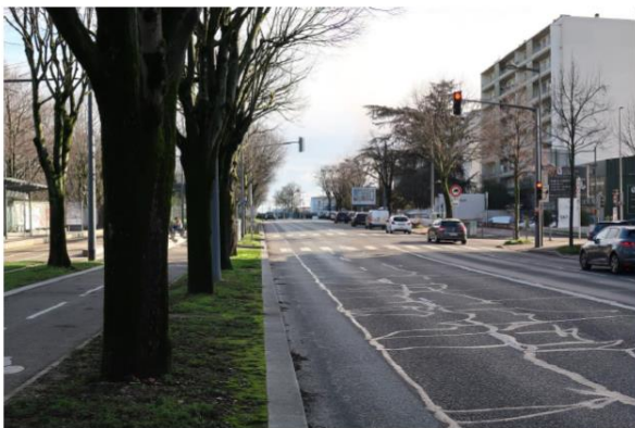
Photographie de l'avenue Roosevelt au niveau de la station de tramway Essarts-Iris.

Ce secteur suit l'avenue Roosevelt sur 1,1 km pour arriver sur la commune de Bron et le giratoire de la Boutasse. Actuellement équipé d'un aménagement cyclable très routier, il soulève de nombreux enjeux de cohabitation des usagers et de confort des modes de déplacements doux. Il n'y a notamment pas de trottoir au nord de l'avenue Roosevelt côté Vinatier. Le tracé, qui suit les deux lignes de tramway (T2 et T5) et la liaison routière avec le périphérique Bonnevay présente de gros enjeux notamment de sécurité avec les trois carrefours traversés : Pinel/Rockefeller, l'échangeur du périphérique Bonnevay et le carrefour de la Boutasse. Les travaux débuteront en 2026 sur ce secteur.