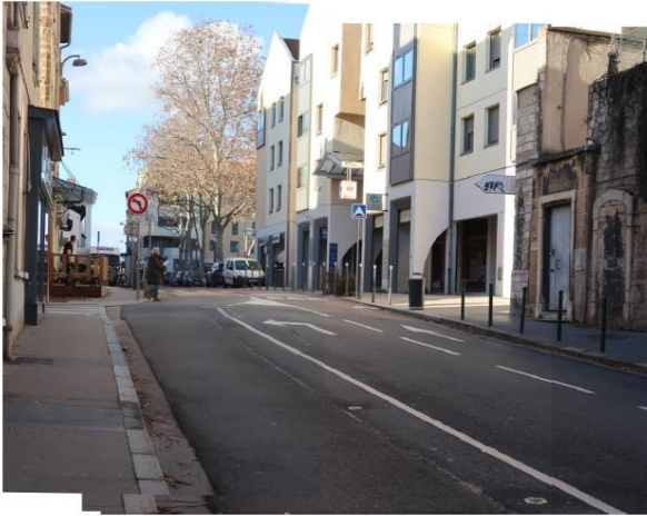
Photographie de la rue de Trion, vue en direction de la place Varillon.