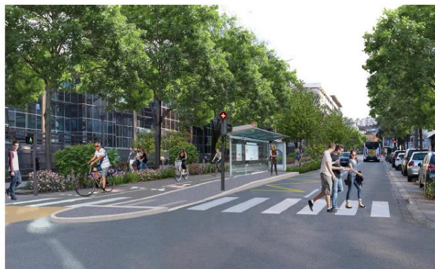
Perspective de l'insertion d'une piste cyclable bidirectionnelle sur la rue du Sergent Berthet.

À partir de Gorge de Loup, la VL12 montera vers le 5 ème arrondissement par les aménagements cyclables déjà existants dans la rue Pierre Audry, jusqu'à la place de Trion. Des études complémentaires seront nécessaires pour affiner le tracé définitif.