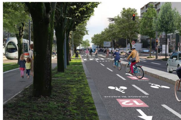
Perspective de la proposition d'une piste cyclable bidirectionnelle sur l'avenue Roosevelt.