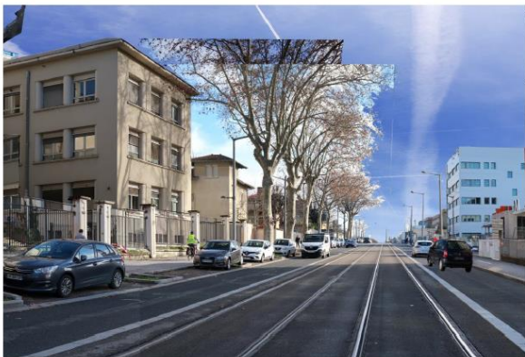
Photographie de l'avenue Rockefeller.

La Voie Lyonnaise 12 se poursuivra sur les cours Gambetta et Albert Thomas avant de rejoindre l'avenue Rockefeller. Sur cette artère, l'aménagement du tramway T2 au début des années 2000 n'avait pas anticipé les besoins en matière d'infrastructures piétonnes et cyclistes. L'inexistence d'aménagements dédiés crée un point noir majeur et rend le partage de l'espace public difficile. Afin de pouvoir réserver le trottoir aux seuls piétons, une piste cyclable bidirectionnelle sera insérée en lieu et place d'une voie automobile. Depuis boulevard Ambroise Paré au boulevard Pinel, l'avenue sera mise à sens unique sur cette section dans le sens Bron vers Lyon. De la végétation sera plantée à l'emplacement des places de stationnement du côté nord de la rue.