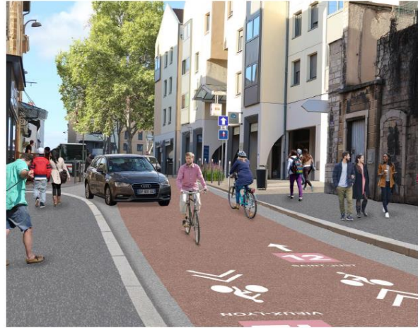
Perspective de la vélorue sur la rue de Trion, vue en direction de la place Varillon.

La Métropole de Lyon a travaillé en étroite collaboration avec la Mairie de Lyon et celle du 5 e arrondissement afin de faire émerger un projet cohérent pour les différents usages, adapté à l'aménagement urbain de ce secteur.