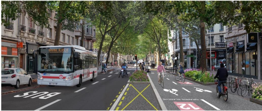
Perspective de la proposition d'une piste cyclable avec bande paysagère et fonctionnelle sur le cours Gambetta.

Début des travaux par secteur : Fin d'année 2024 pour l'expérimentation sur le secteur Rockefeller – Début 2025 pour le secteur Presqu'île, Cours Gambetta et Cours Albert Thomas – 2026 pour le secteur Roosevelt.