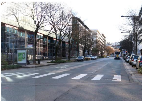
Photographie de la rue du Sergent Berthet au niveau de l'arrêt Sergent Berthet.

La Voie lyonnaise n°12 débutera place Valmy dans le 9 ème arrondissement de Lyon. Elle circulera le long de la rue Sergent Michel Berthet, un axe majeur jalonné de commerces, de bureaux ou de campus universitaires, sous forme d'une piste cyclable bidirectionnelle, jusqu'à la gare de Gorge de Loup.